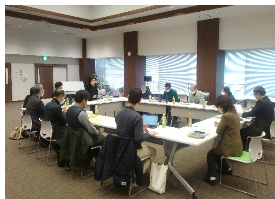
担い手部会の様子(2024.2.7.)